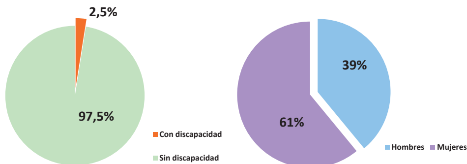
Gráfico 1. Personas tituladas en Sociología según situación de discapacidad y por sexo.

Nota: Considérese aquí que, a efectos de estimación del volumen de personas tituladas, la fuente utilizada advierte que "no se dispone de información de la Universidad Pablo de Olavide" (INE, 2016).