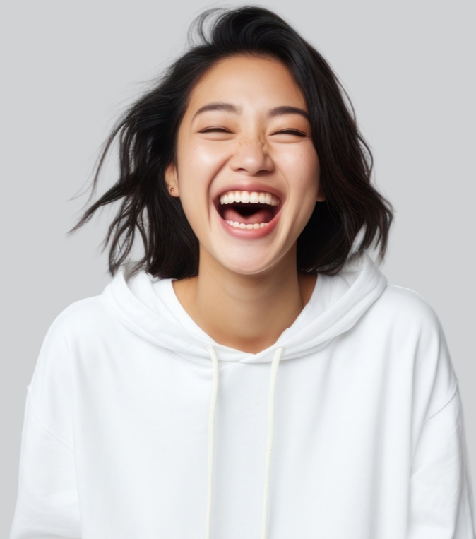
Imagen generada por la IA

Como se ha introducido antes, la IA ha surgido como herramienta capaz de transformar la docencia y el aprendizaje. Es más, ofrece oportunidades para mejorar y personalizar la experiencia educativa, tanto desde el punto del estudiante como del profesorado. En conjunto, puede ser entendida como un elemento que nos ayude en diferentes aspectos vinculados a la docencia y la innovación educativa.