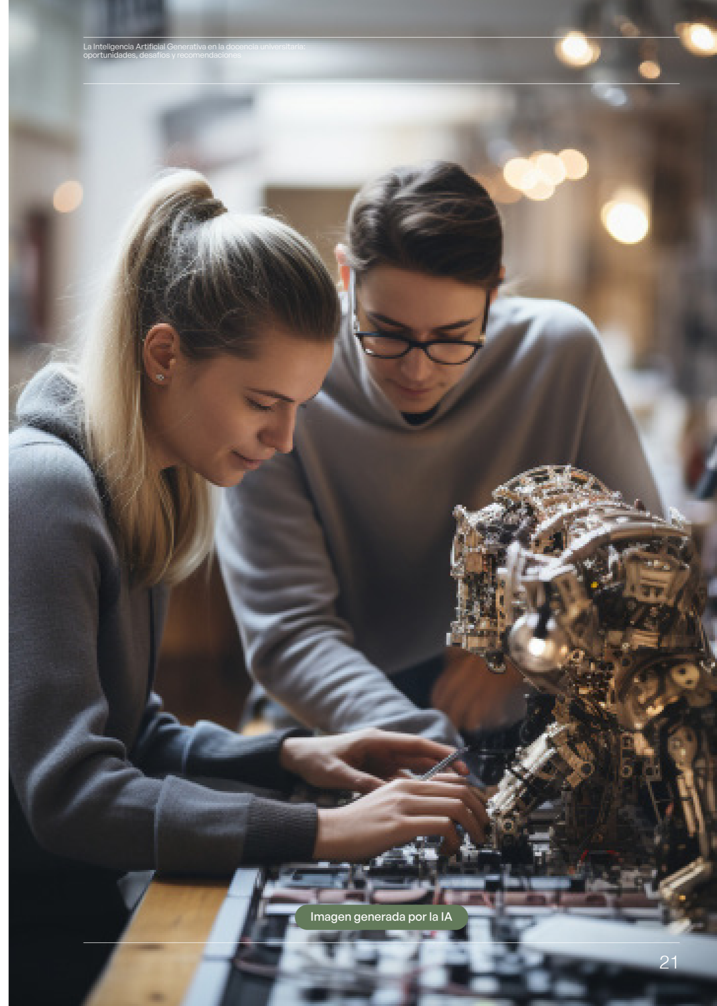
Imagen generada por la IA