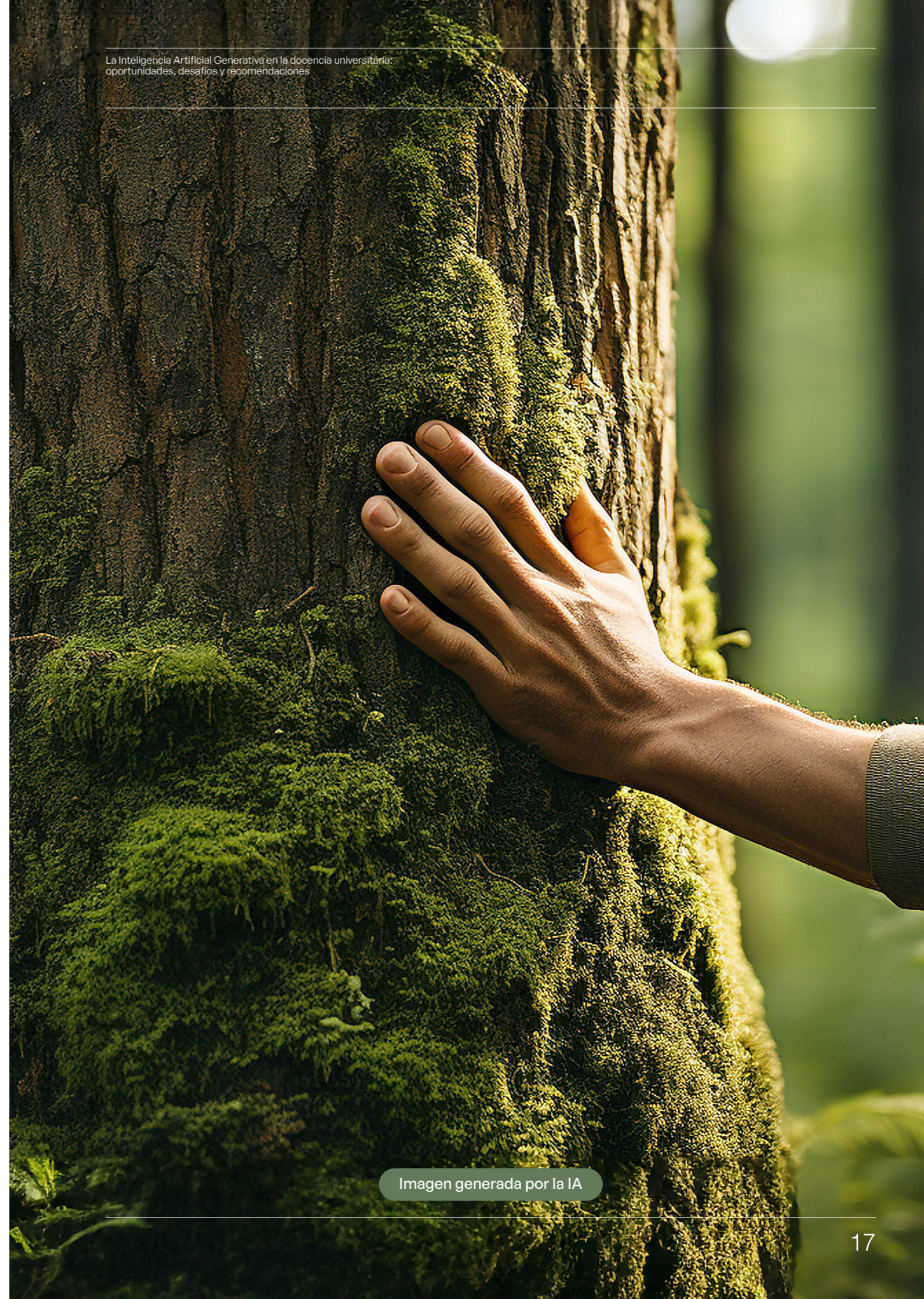
Imagen generada por la IA

En dicha línea, y cuando sea posible, se debería visibilizar y sensibilizar a la comunidad universitaria sobre esta cuestión, haciendo un uso responsable de esta tecnología para reducir la huella ecológica. Por otra parte, también es importante considerar el reciclaje y reutilización de los componentes de hardware cuando sea posible. Esto implica no solo la recuperación de materiales valiosos, sino también la actualización y mantenimiento adecuado de los dispositivos existentes en lugar de adquirir nuevos.