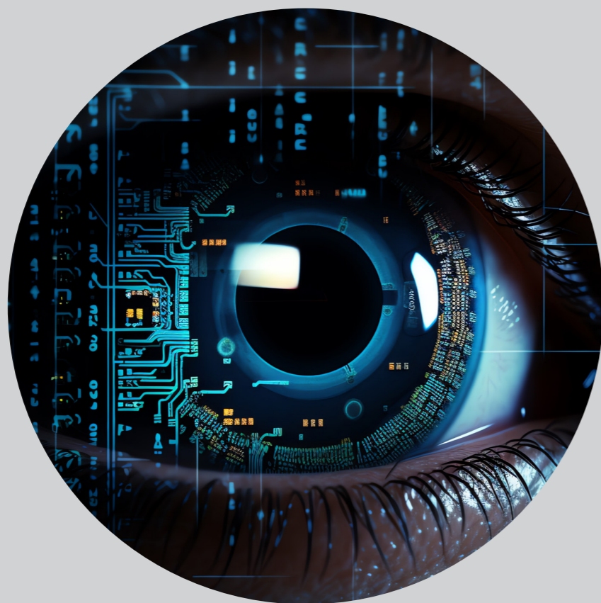
Imagen generada por la IA

Esta sección cubre los aspectos a considerar en el uso de la IAG desde el punto de vista ético.