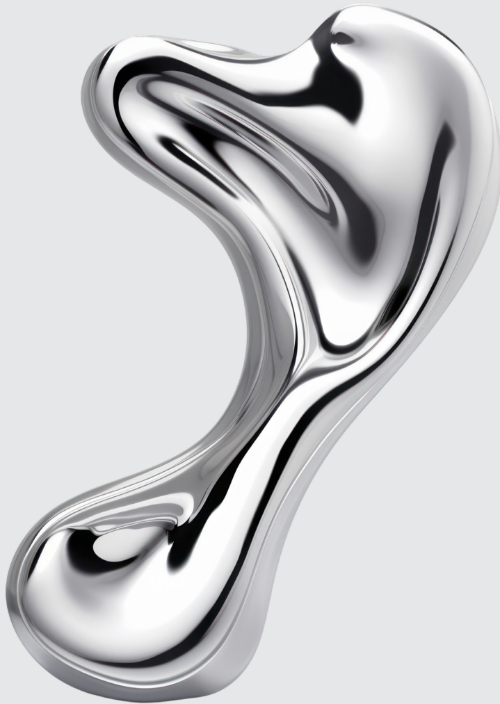
Imagen generada por la IA

Oportunidades, desafíos y recomendaciones