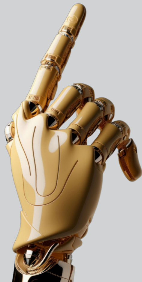
Imagen generada por la IA

Después del análisis presentado sobre desafíos y oportunidades, a continuación, pasamos a presentar los principales aspectos a destacar y las posibles recomendaciones y siguientes pasos que entendemos que se deben dar para su adopción en la educación superior.