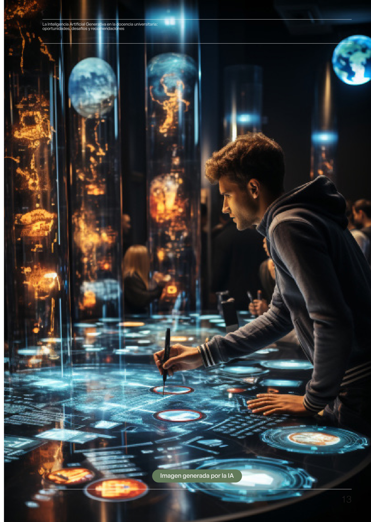
Imagen generada por la IA

Todo esto implica enseñar a evaluar de manera objetiva la información, cuestionando fuentes y perspectivas tratando de verificar los datos antes de aceptarlos como verdaderos.