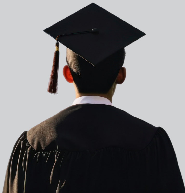
Imagen generada por la IA

Parece evidente que el avance de la IAG en la educación universitaria es imparable, pero su rápida evolución ha provocado que todavía existan retos a los que hay que enfrentarse.