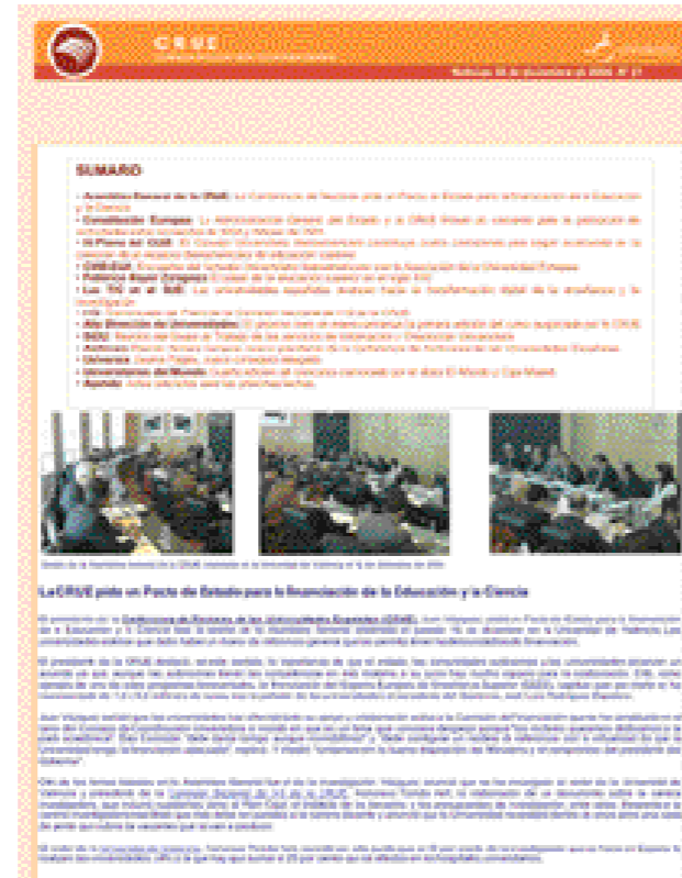
Boletín electrónico quincenal CRUE Noticias.

Superior en el siglo XXI, organizada por la UNESCO y celebrada en París en 1998 o la Primera Convención de instituciones europeas de enseñanza superior, que tuvo lugar en la Universidad de Salamanca en 2001. Al lado de ellas, han sido muy numerosas las reuniones de todo tipo promovidas por la CRUE y por sus Comisiones Sectoriales sobre un amplio abanico de temas que van desde la demografía a la proyección social de la universidad o de los indicadores de calidad a las nuevas tecnologías, del profesorado y la docencia a la investigación, de la cooperación a las relaciones internacionales, pasando por jornadas tan consolidadas como la que celebra anualmente la Mesa de Gerentes. A lo largo de su historia la CRUE ha logrado, además, impulsar con éxito una línea de estudios y publicaciones que han crecido en número, temas e interés con el paso del tiempo. Desde la revista Diálogo Iberoamericano hasta la emblemática publicación La Universidad española en cifras , que ha alcanzado ya su tercera