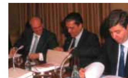
Arriba, Presentación del Informe Universidad 2000. Derecha, Reunión del Patronato del Informe Universidad 2000, 24 de marzo de 2000.