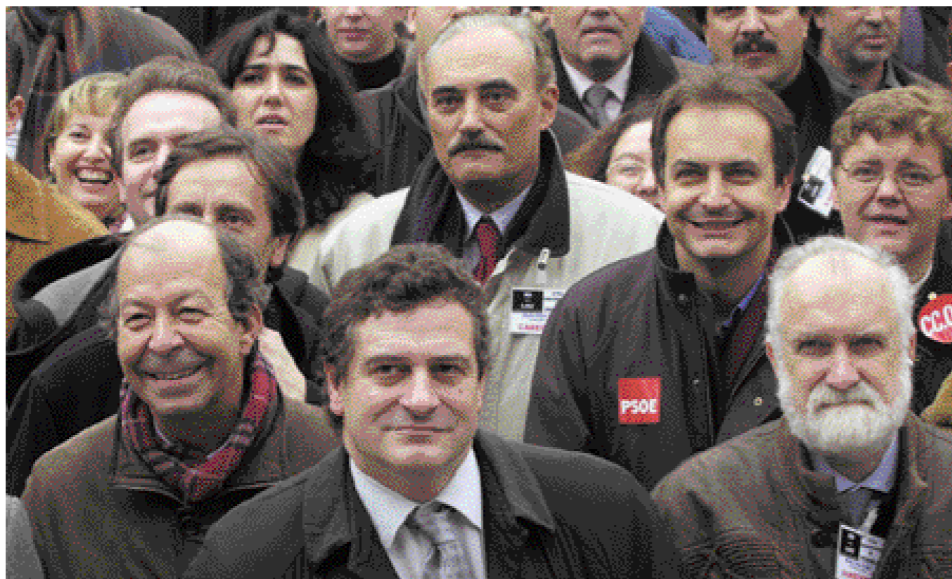
Manifestación celebrada el 1 de diciembre en contra de la LOU.