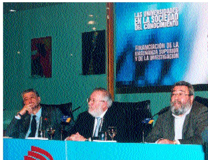
I Foro Universidad-Sociedad de la CRUE, Madrid, 14 y 15 de enero de 2004.

La apertura de la universidad a la sociedad y el estrechamiento de los vínculos de interrelación ha sido uno de los objetivos prioritarios de la CRUE desde el momento mismo de su fundación, en el que se ha avanzado muy sensiblemente a lo largo de estos pasados diez años y que adquiere una reforzada y decisiva importancia para el presente y el futuro de la Universidad en esta era de la sociedad del conocimiento. Durante esta década y propiciando el diálogo, la cooperación y la búsqueda de acuerdos, la CRUE ha mantenido una amplia serie de reuniones y contactos institucionales. En el acuerdo o en la discrepancia, se ha tratado de mantener, ante todo, la comunicación con los responsables del Ministerio de Educación a lo largo de la década (los Ministros, Gustavo Suárez Pertierra, Jerónimo Saavedra Acevedo, Esperanza Aguirre Gil