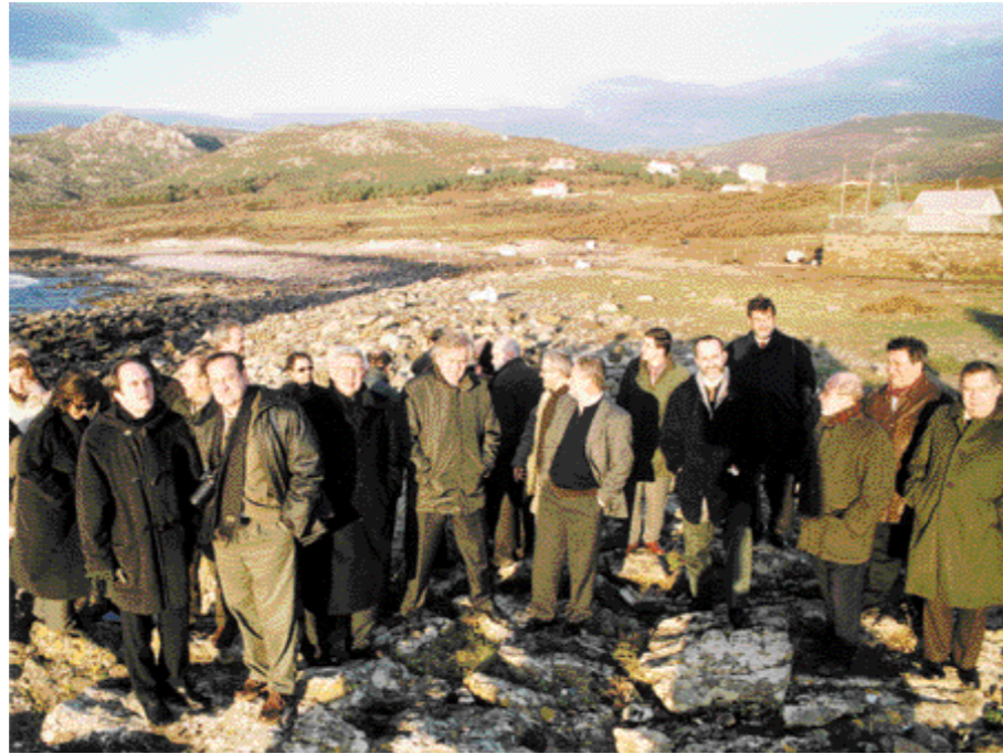
Asamblea General de la CRUE, 10 de enero de 2003, Santiago de Compostela.

La guerra de Irak proporcionó una nueva ocasión para la expresión de la conciencia social de los universitarios, canalizada en este caso a través del manifiesto suscrito por un elevado número de Rectores y por