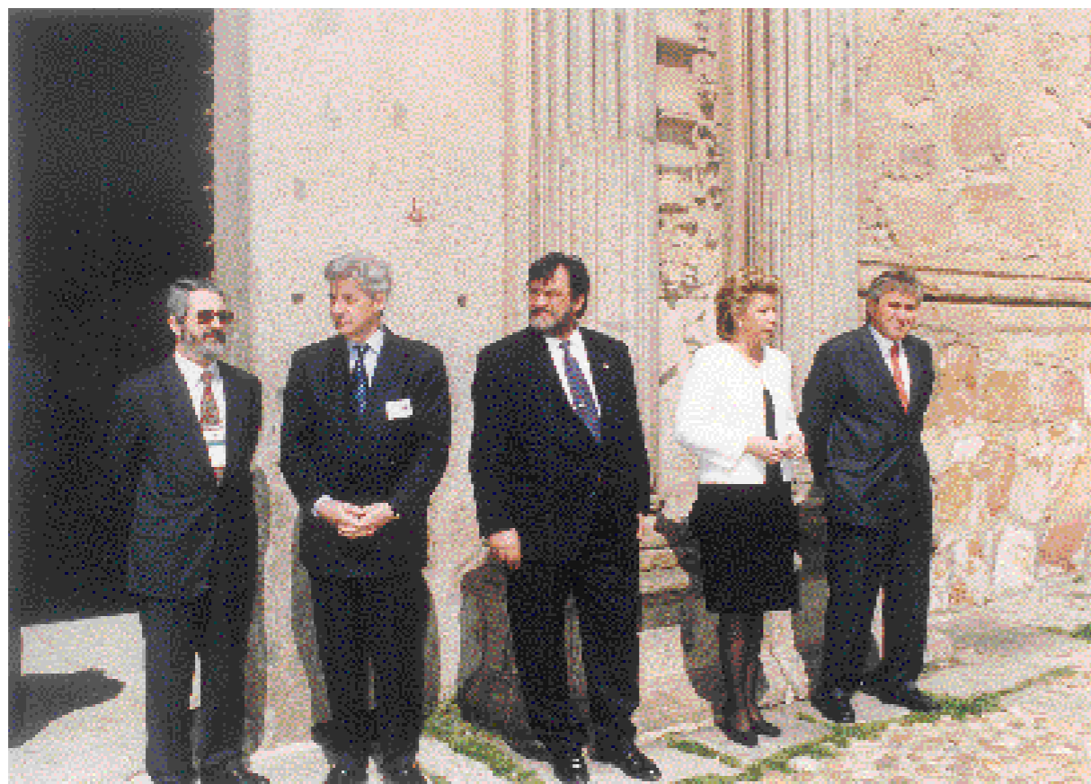
Convención de instituciones europeas de enseñanza superior, Salamanca, 29 y 30 de marzo de 2001.

Europeas, ha estado presente en las principales reuniones de las universidades europeas, que han marcado los hitos más destacados del proceso de convergencia de los sistemas universitarios del continente: Declaración de Bolonia en 1999, pasando por la Convención de instituciones europeas de educación superior celebrada en España, en la Universidad de Salamanca, y organizada por la CRUE, hasta las Conferencias de Praga, Graz y Berlín.