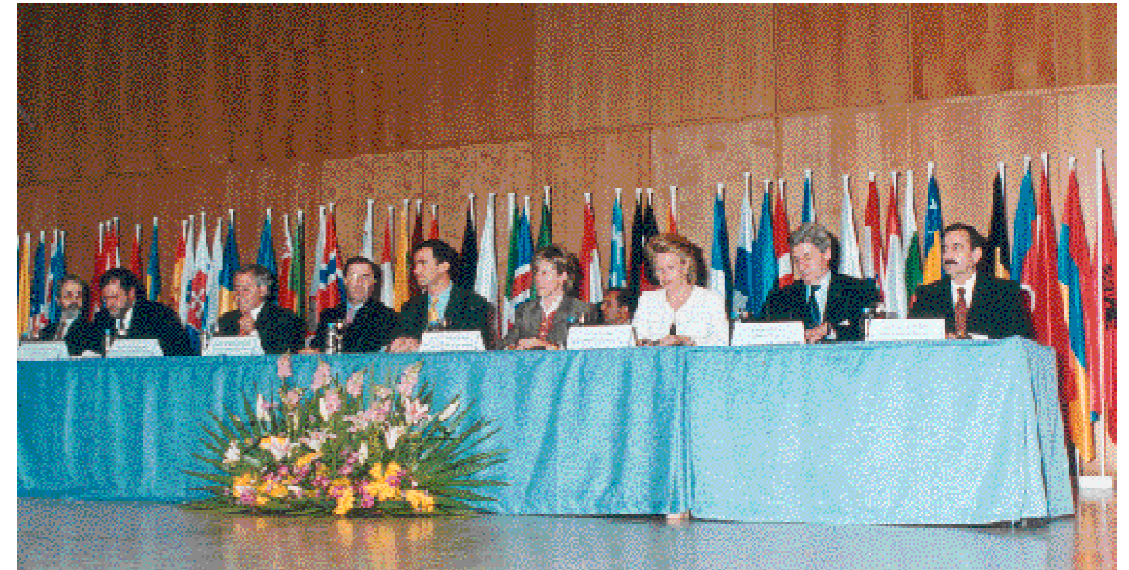
Convención de instituciones europeas de enseñanza superior, 29 y 30 de marzo de 2001, Salamanca.

habilitación, los Decretos de Grado y Postgrado para la implantación del Espacio Europeo de Educación Superior o la orientación de la reforma de la LOU, entre otros. En tercer lugar, la contribución decisiva de la CRUE a la implantación del distrito abierto y al impulso a la movilidad y los intercambios de estudiantes tanto hacia el exterior, a través de programas como Erasmus e Intercampus, como muy especialmente entre las propias Universidades españolas mediante el Programa SICUE, que ha cumplido ya cinco ediciones con una oferta anual superior a las veinte mil plazas. Junto a esta línea de trabajo, la CRUE ha desplegado permanentemente otra destinada a promover el conocimiento, la reflexión y el debate a través de muy diversas reuniones, conferencias y jornadas, entre las que cabe destacar por su alcance y proyección internacional la Conferencia de Salamanca de 1998 sobre "Los objetivos de la Universidad ante el nuevo siglo", la participación en la Conferencia Mundial sobre la Educación