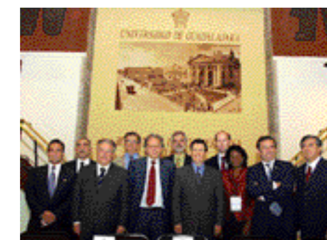
Arriba, Convención de instituciones europeas de enseñanza superior, Salamanca, 29 y 30 de marzo de 2001.