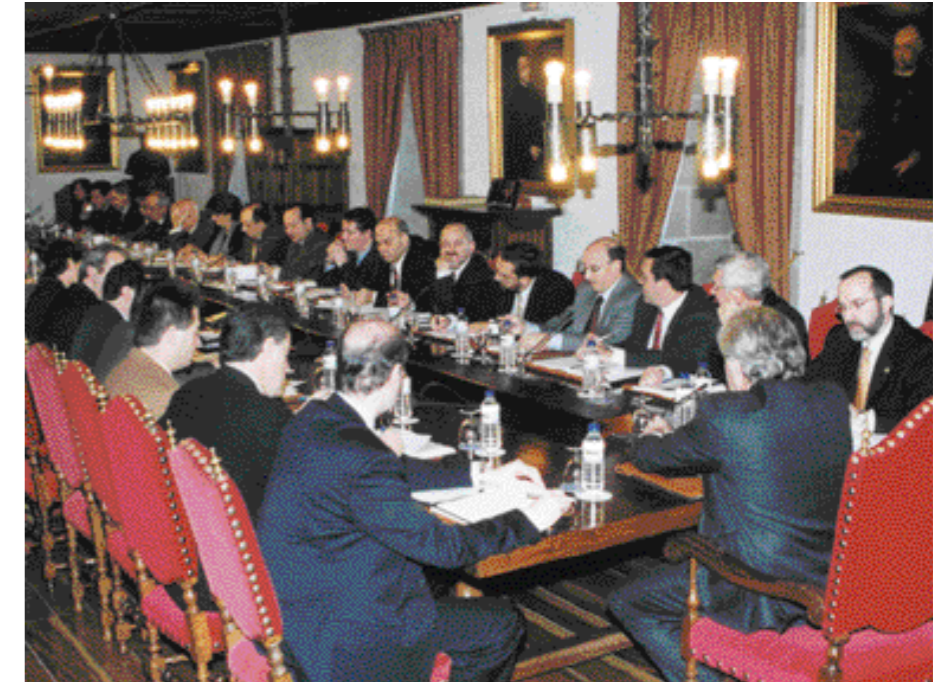
Asamblea General de la CRUE, 10 de enero de 2003, Santiago de Compostela.

Otra serie de catástrofes, como la más reciente del Tsunami, han puesto de relieve la reacción solidaria de los universitarios. Han ido prendiendo y consolidándose estructuras y organizaciones destinadas a fines humanitarios y de cooperación, con el apoyo institucional de las Universidades, con un protagonismo destacado de los estudiantes y una participación creciente de los miembros de la comunidad universitaria, en el marco de los objetivos establecidos por el documento de la CRUE sobre Estrategia de cooperación universitaria al desarrollo .